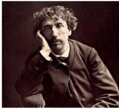
Le génie de Cézanne Mélange d'inspiration