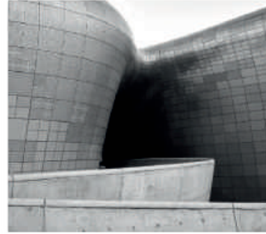
Les colonnes du Salon de Gustave Gullon Mélange d'inspiration