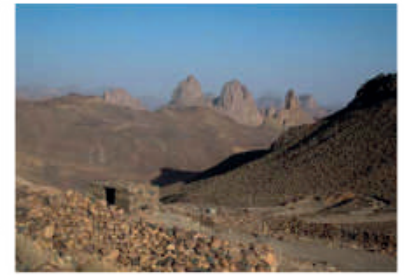
Le génie de l'architecture Mélange d'inspiration