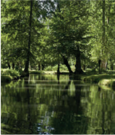
Le génie de la nature Mélange d'inspiration