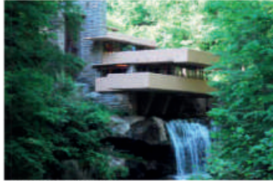
L'architecture moderne à la Frank Lloyd Wright Mélange d'inspiration