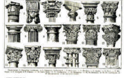
Les colonnes du Salon Mélange d'inspiration