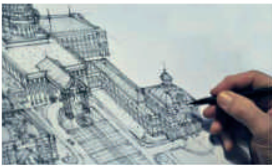
Le dessin à la main Mélange d'inspiration